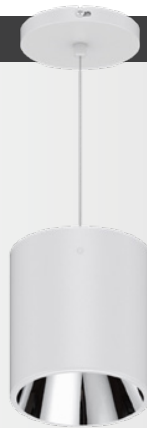
H = Pendel-Leuchte