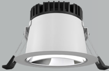
C = für gesägte Decken