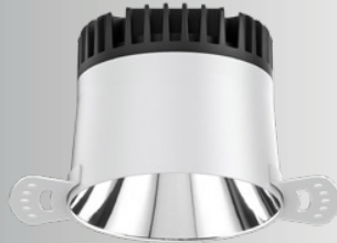
U = Unterputz