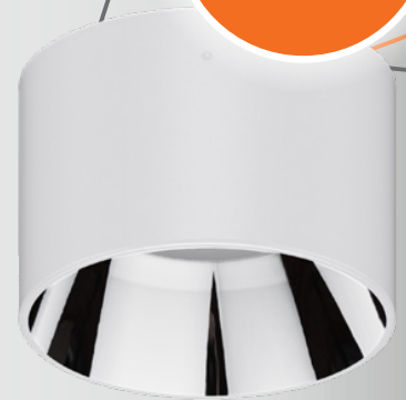
A = Aufbaugehäuse